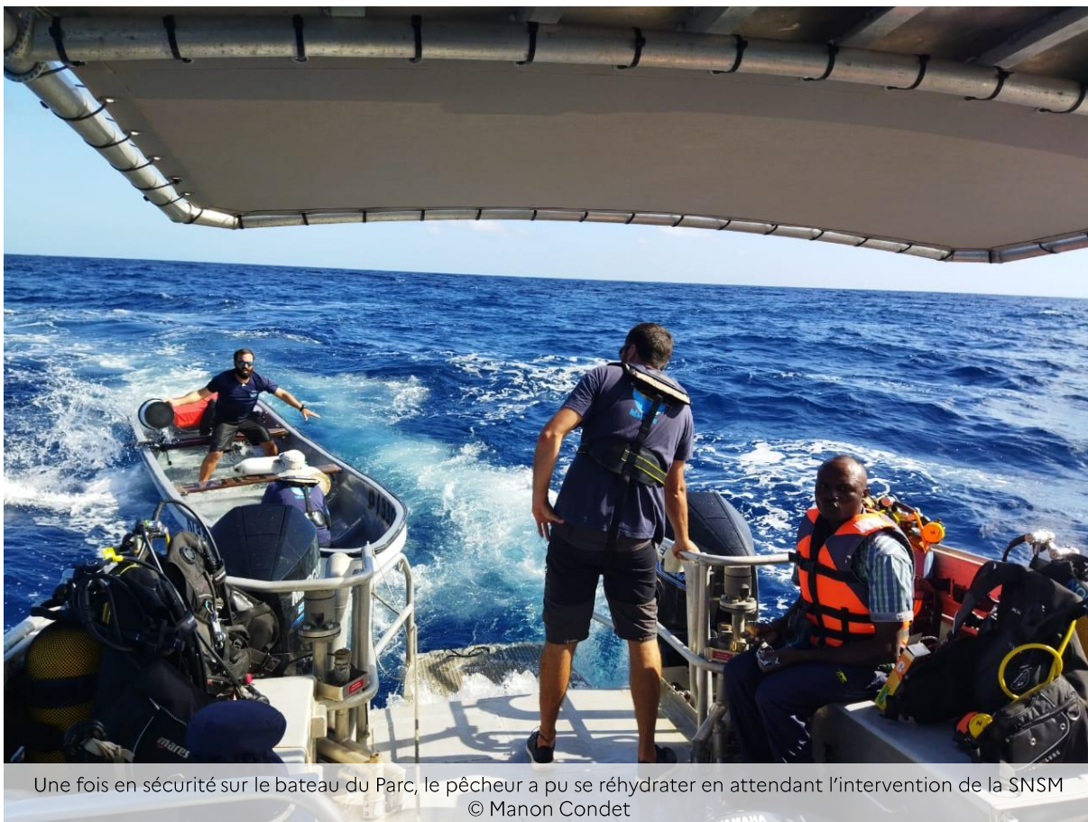
Une fois en sécurité sur le bateau du Parc, le pêcheur a pu se réhydrater en attendant l'intervention de la SNSM