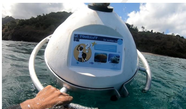
Une des 7 bouées pédagogiques du sentier sous-marin de Mtsangafanou