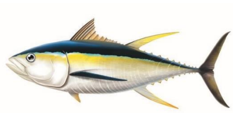
Thon albacore ( Thunnus albacares )

En tant qu'instance de gouvernance d'une aire marine protégée, le Bureau du Parc propose que la pêche à la senne soit interdite dans le Parc naturel marin de Mayotte à compter du 1 er janvier 2022.