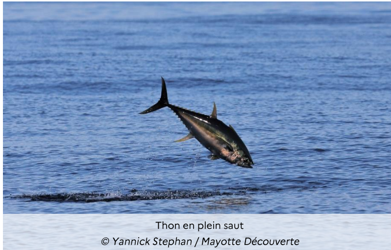
Thon en plein saut