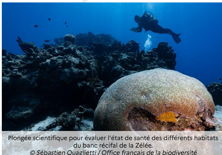
Plongée scientifique pour évaluer l'état de santé des différents habitats du banc récifal de la Zélée.