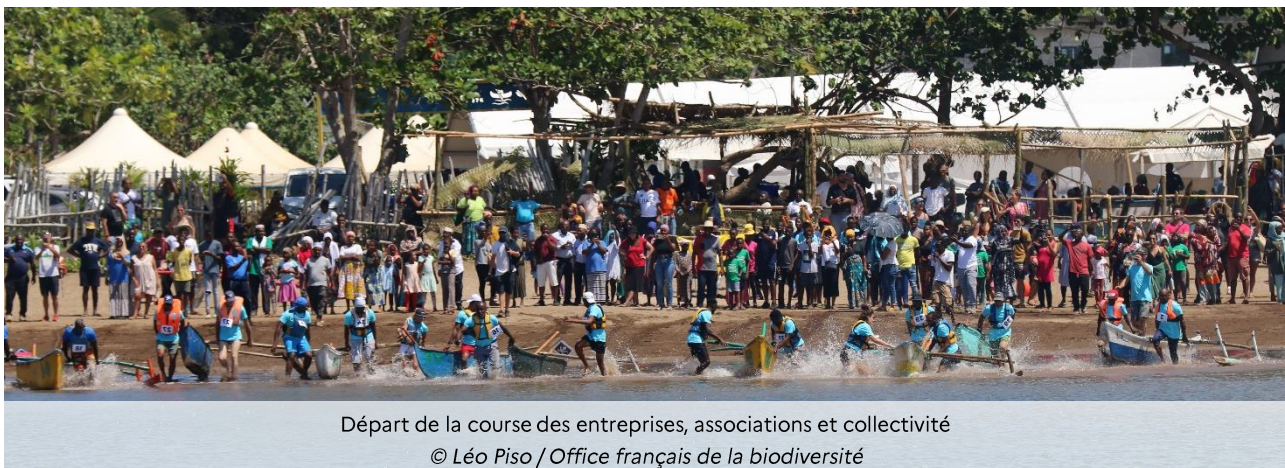
Départ de la course des entreprises, associations et collectivité

Le Parc naturel marin a voulu un événement « zéro plastique » et tous les partenaires ont joué le jeu. La mairie de Kani-Keli a effectué un nettoyage irréprochable du site avant l'événement. Les restaurateurs ont été formés par la communauté de communes du Sud pour mettre en place des stands de restauration sans plastiques jetables. Des gourdes réutilisables ont été offertes aux concurrents. L'association Laka a réalisé un bon nombre d'aménagements en bambous et des poubelles en coco tressé.