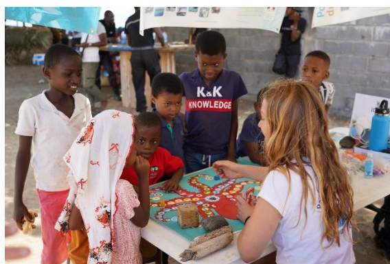
Jouer pour parler de pêche durable sur le stand du Parc