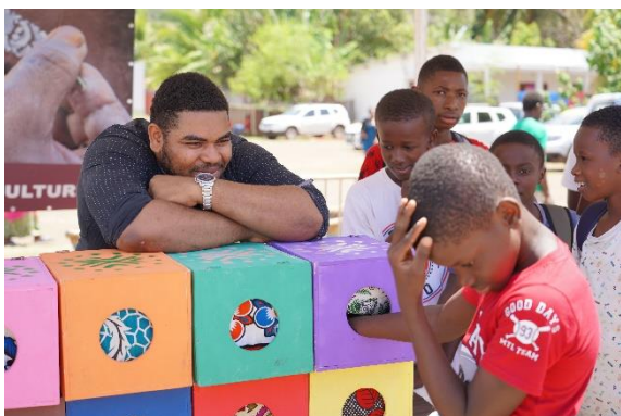
Les boîtes mystères sur le stand du Musée de Mayotte