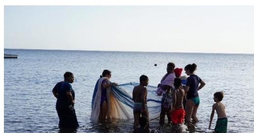
Atelier djarifa : les pêcheuses invitent le public à participer