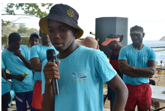
Un gagnant du défi des jeunes exprime sa fierté